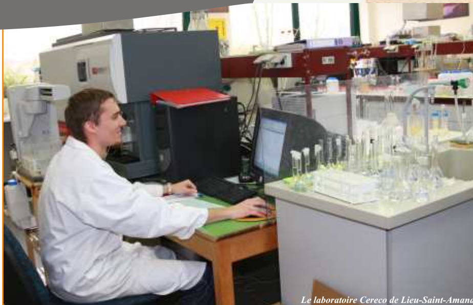
Le laboratoire Cereco de Lieu-Saint-Amand